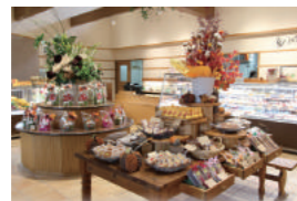
季節ごとに、様々なお菓子を揃えてお待ちしております