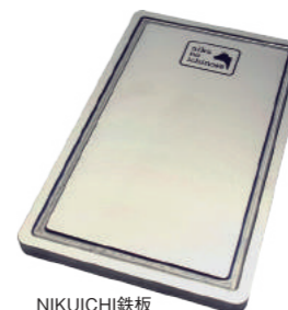
NIKUICHI鉄板(取手・本革ケース付き)

はじわじわとファンが増えているとの事。飯田ならで わの鉄板・ガスコンロ付き焼き肉セット も不動の人気です。