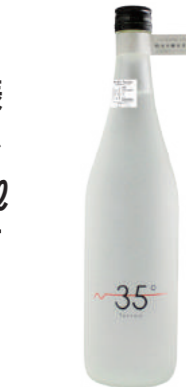
北緯35度のテロワールコーナー