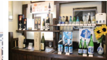
喜久水の日本酒ラインナップ