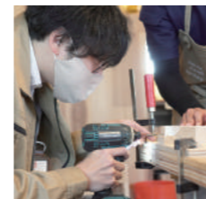
飯田エフエムスタッフも真剣に