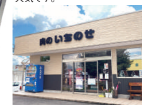
肉のいちのせ店舗外観