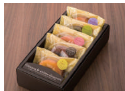
鮮やかな5色。味は、プレーン・抹茶・和三盆・ストロベリー・チョコレート

皆様に「毎日でも食べたい」と思ってもらえる、 手作りの美味しさの追求 を続けています。お店の品は全て、卵、バター、小麦粉などの素材にもこだわり、風味豊かに仕上げました。特にフルーツは、地元果樹農家の方から直接分けて頂き、ケーキやパフェにふんだんに使っています。また、特別なお祝い・お誕生日ケーキも事前のご予約でご用意いたします。お子様から大人の方まで様々な場面で召し上がって頂けるよう、 1975年の創業以来、優しい味 を守っています。