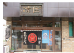
1850年(嘉永三年)に創業

江戸時代から変わらぬ染技法と染料で染め上げた木綿生地、 日常でも使い易い よう手揚げ袋なども制作しております。この生地は、法被などのお祭り用品や獅子舞囃(ほろ)と同様の仕上げですので、 使い込むほどに風合いが増 てきます。ぜひ、お使いください。また最近では、帆布(はんぷ)生地でも染め上げ、小物のデザインの幅も広がっております。肩掛けバッグ、ワインボトル(一升瓶)カバー、ペットボトルホルダー、巾着、などなど、ひとつからでもご用命ください。オーダーでの作製も承っております。お気軽にお問い合わせください。